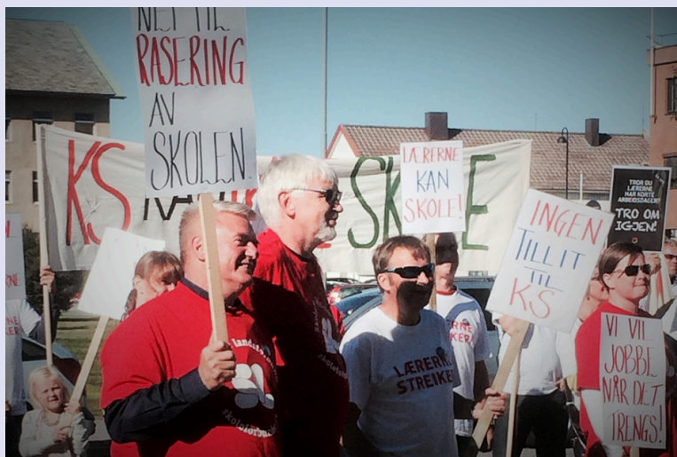
Lærerstreiken 2014, Bodø.